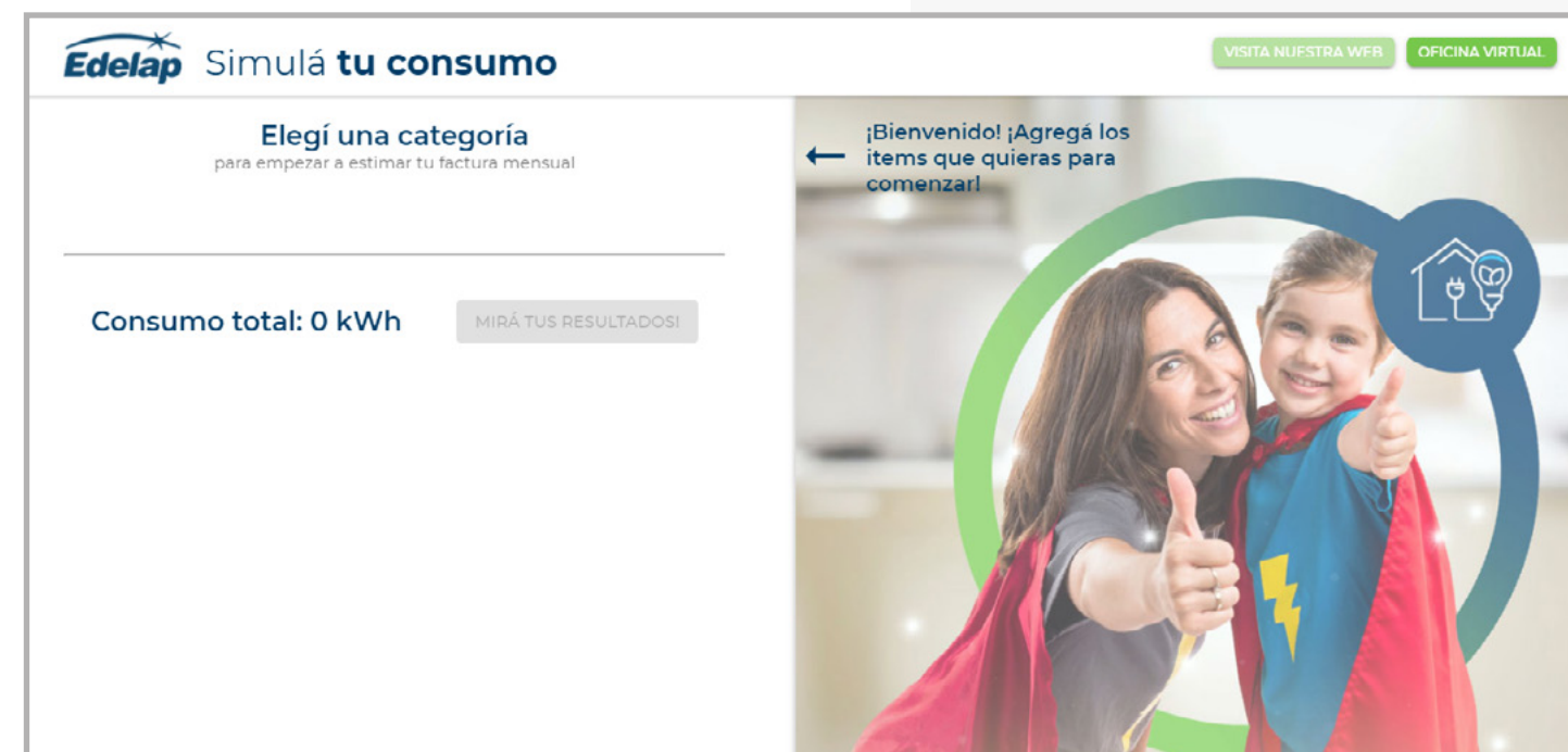
Link Simulador de Consumo EDELAP